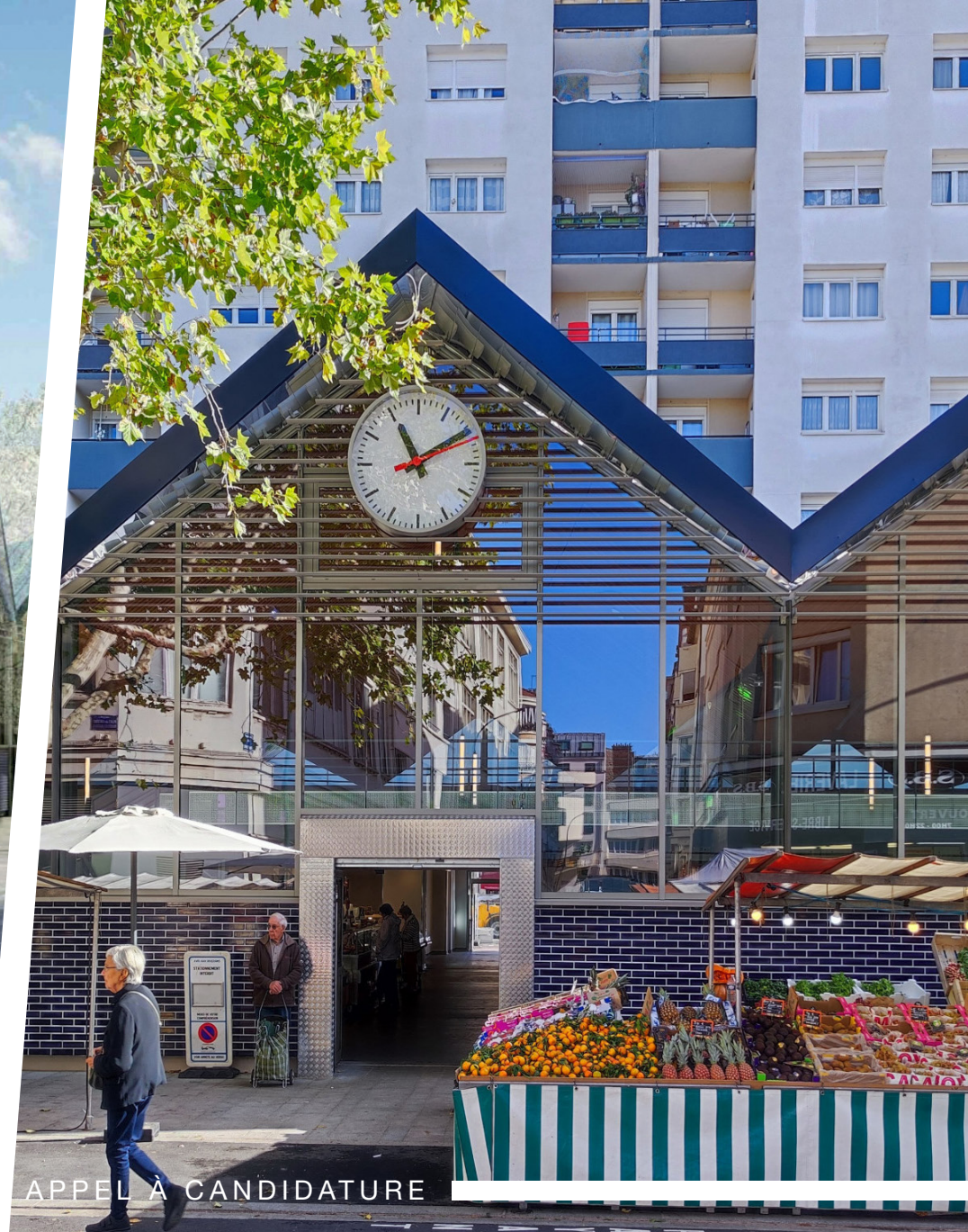
APPEL À CANDIDATURE

Rejoignez la nouvelle Halle gourmande d'Asnières-sur-Seine